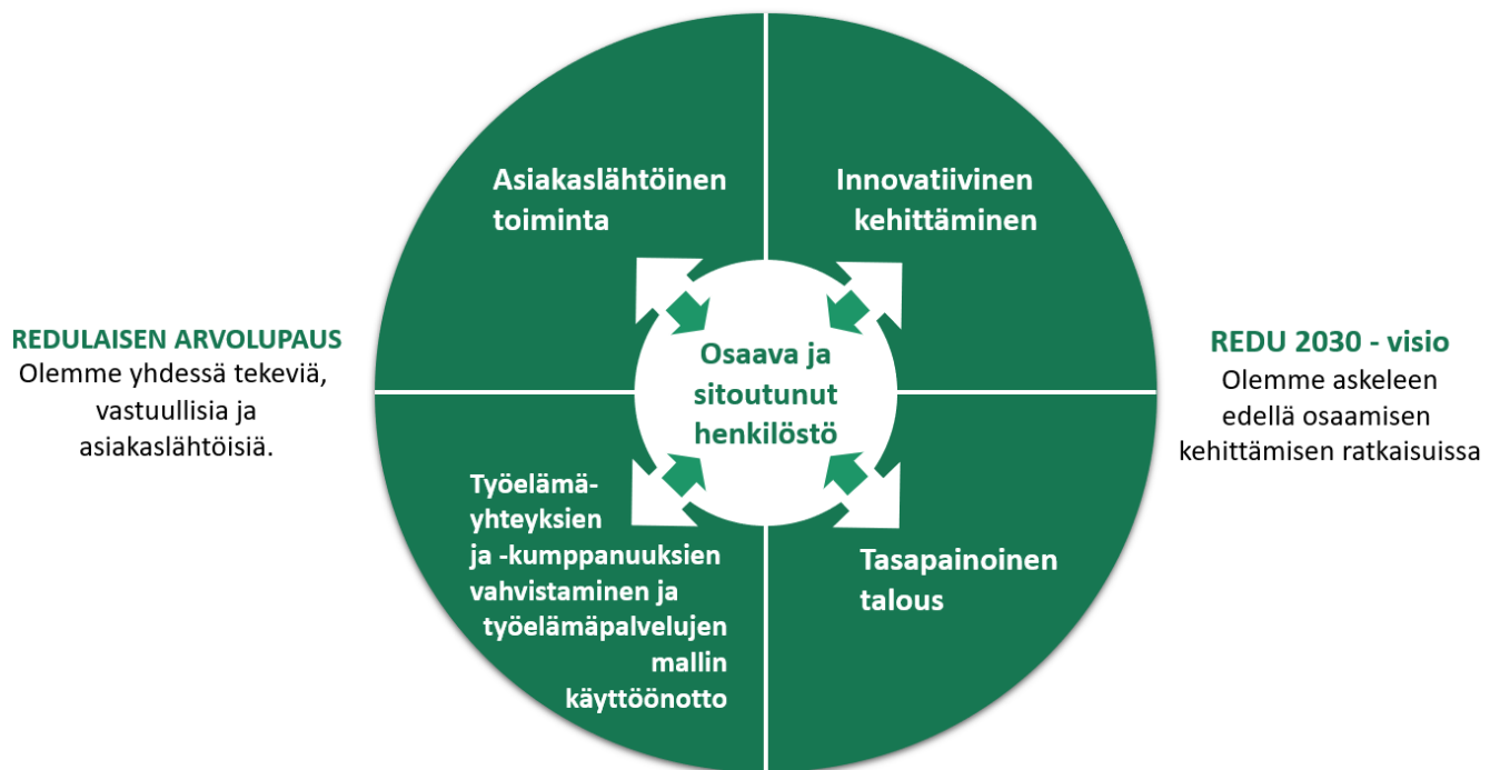
KUVA 2. REDUn arvolupaus, visio 2030 ja strategiset kehittämisen painopistealueet 2021–2023

Seuraavilla sivuilla olevissa taulukoissa 1–5 on esitetty painopistealueittain toimintavuoden 2023 sitovat tavoitteet sekä niihin toteuttamiseen liittyvät keskeisimmät riskit.