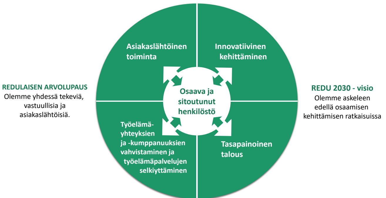
KUVA 2. REDUn arvolupaus, visio 2030 ja strategiset kehittämisen painopistealueet 2021-2023

Seuraavilla sivuilla olevissa taulukoissa 1–5 on esitetty painopistealueittain toimintavuoden 2021 sitovat tavoitteet sekä niihin toteuttamiseen liittyvät keskeisimmät riskit.